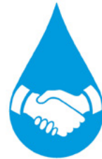
Eventos Sociales y Culturales

Desde 1965 los miembros de la AMH hemos participado en el desarrollo y fortalecimiento del sector hídrico, colaborando para el abastecimiento urbano y rural, la producción de energía, la agricultura y la industria.