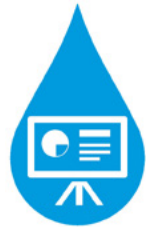
Sesión de Posters