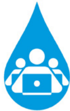
Talleres y Cursos