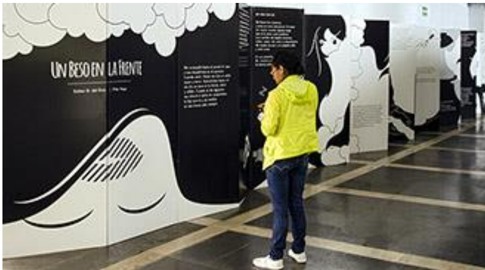
Exposición Un Beso en la Frente

La exposición es un llamado a la comunidad estudiantil para tomar consciencia sobre la violencia de género y para vivir relaciones sanas libres de ella, además de una muestra de apoyo para que quienes la sufren sepan que pueden reorientar su camino.