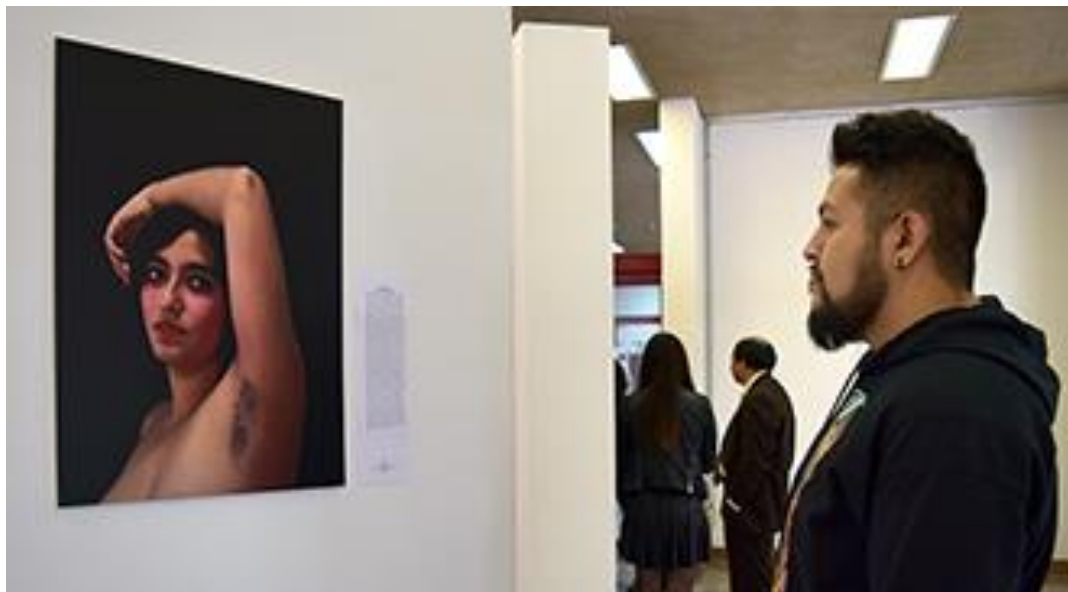
Detalle de la exposición

El artista explica que acompaña las fotos de un texto, puesto que es importante que, además de la imagen, entendamos la historia de cada persona retratada, de cómo ha vivido y afrontado la discriminación. "Hay muchas maneras de defender los derechos y de impactar en la sociedad, de transformarla; nosotros propusimos el arte y la fotografía como un buen inicio".