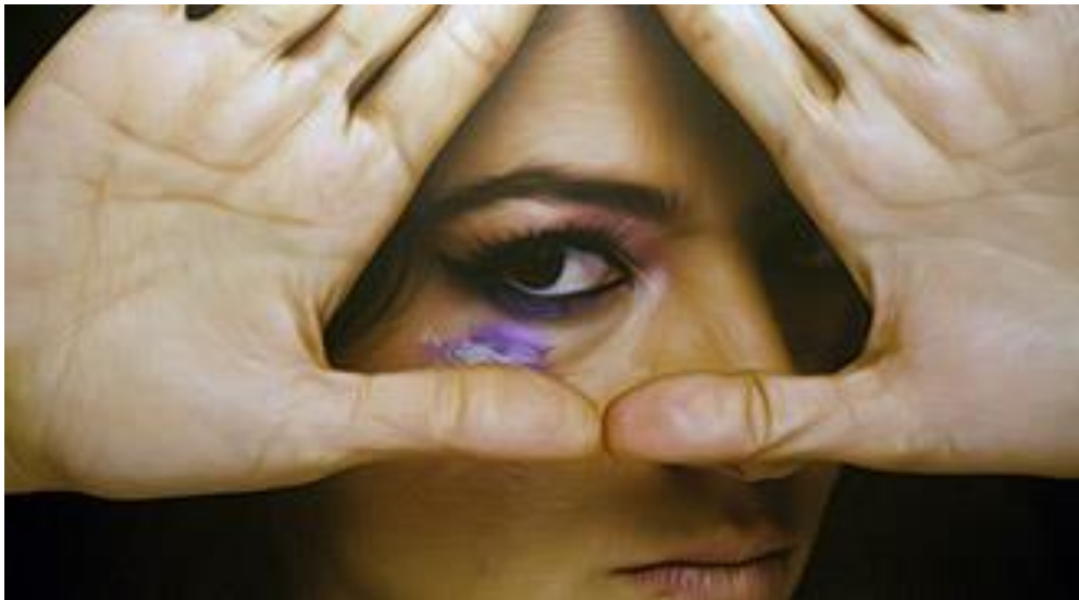
Exposición fotográfica de Alfonso Heredia

Alter ego invita a una interiorización y una profunda reflexión al papel que juega la mujer en estos tiempos y cómo ha reivindicado su capacidad intelectual e integración para contribuir a la construcción de una mejor sociedad.