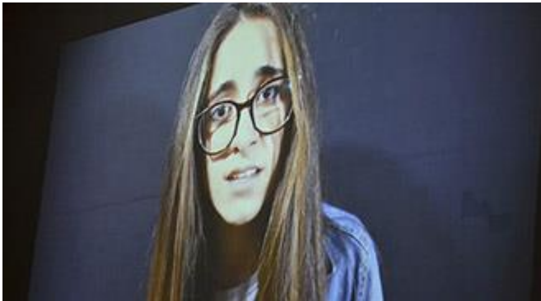
Ahora o Nunca

El conversatorio dio inicio con la pregunta ¿qué es equidad de género? y continuó con reflexiones sobre el feminismo, la discriminación por género y la tipificación de roles de género que se dan en la Facultad de Ingeniería y en otras carreras. Fue un diálogo constructivo en el que tanto conocedores como alumnos compartieron sus vivencias y puntos de vista.